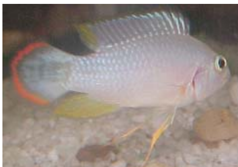
Fig 1. Apistogramma panduro ♀

Los individuos hembras presentaron una longitud total promedio (LT) de 3.83 cm los cuales variaron de 3.5 a 4.4 cm; con un peso total promedio de 0.88g los cuales oscilaron de 0.6 a 1.2 g. La hembra se caracteriza por presentar coloraciones amarillentas y negras que en época de reproducción se intensifican y un rojo intenso en el borde posterior de la aleta caudal.(Fig. 1)