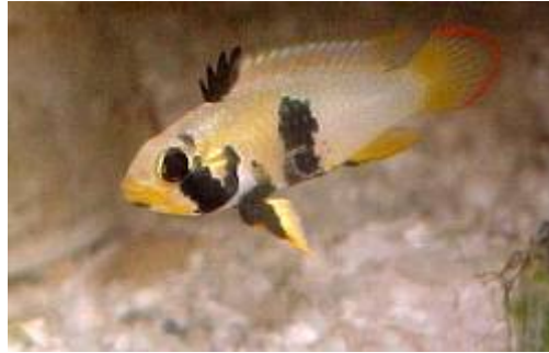
Fig 2. Apistogramma panduro ♂

sus coloraciones van de un celeste plateado con pintas amarillas en las aletas pectorales y ventral y un rojo intenso en el borde posterior de la aleta caudal. (Fig 2).